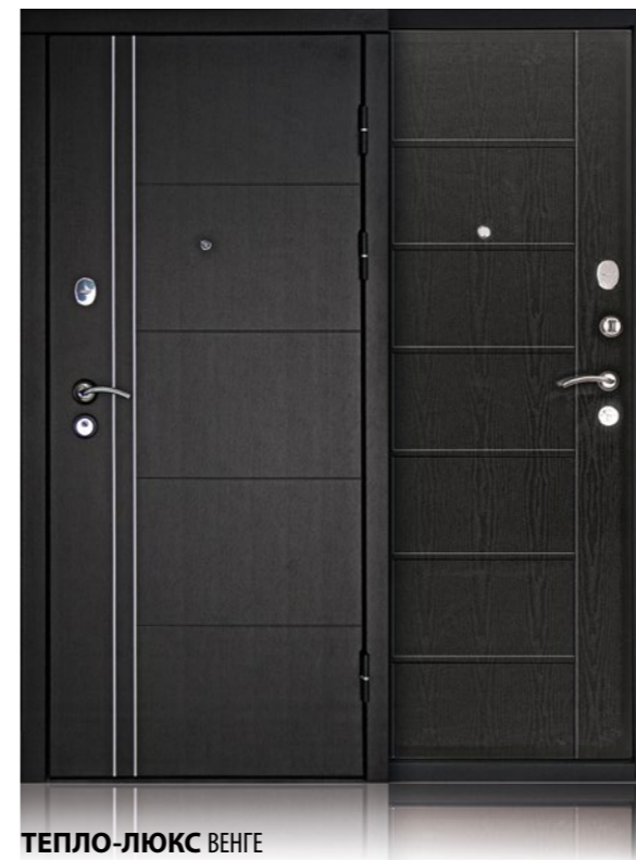
ТЕПЛО-ЛЮКС ВЕНГЕ Внешняя сторона: панель МДФ с молдингами, венге. Внутренняя сторона: панель МДФ, венге.