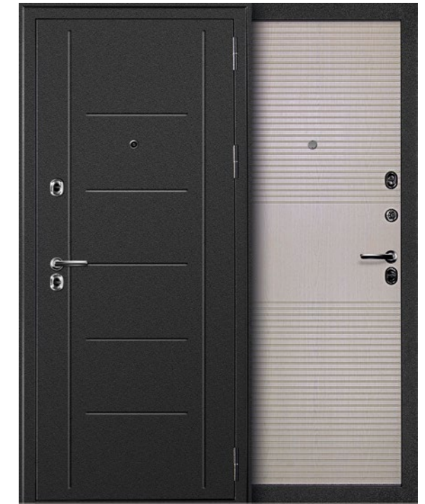
ТЕРМАЛЬ БЕЛЕНЫЙ ДУБ Внешняя сторона: металл, антик серебристый. Внутренняя сторона: панель МДФ, беленый дуб.