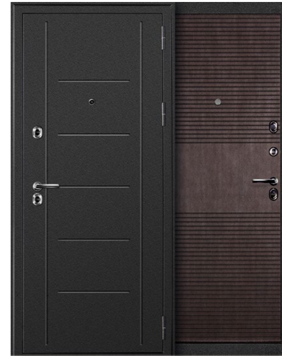
ТЕРМАЛЬ ВЕНГЕ Внешняя сторона: металл, антик серебристый. Внутренняя сторона: панель МДФ, венге.